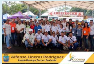
Asociación de Microempresarios del Socorro y la Provincia Comunera "AMESPROCOM"

Consciente que la unión de objetivos consigue resultados que de otra forma serían inalcanzables ha formado parte de importantes asociaciones como: