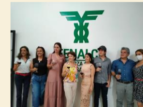
FENALCO, Sur de Santander. "La Fuerza que une"